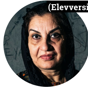
(Elevversion) Del 1